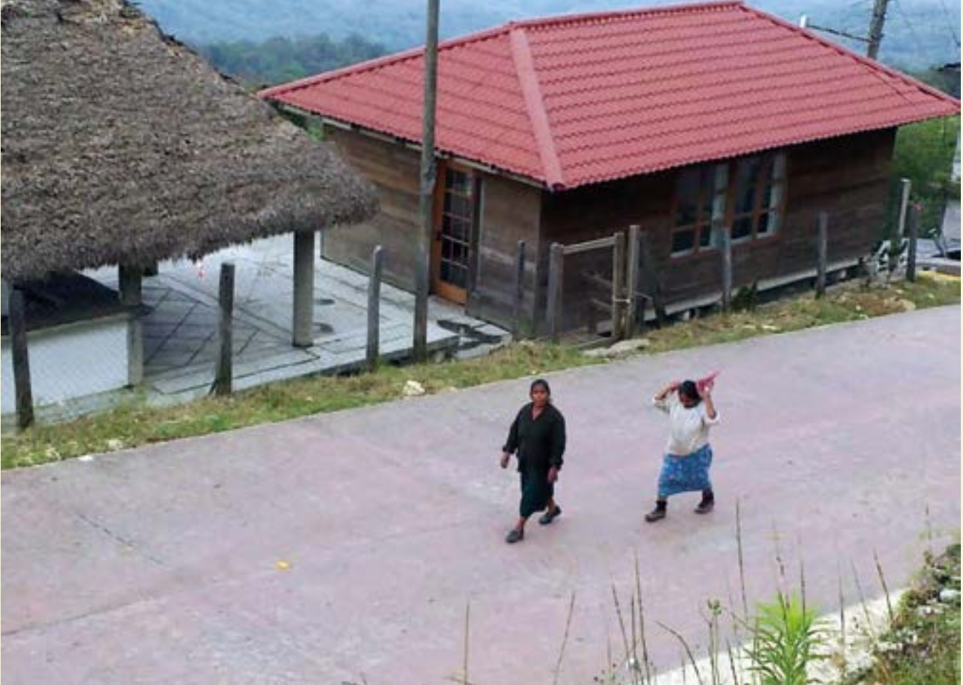
La comunidad de Guadalupe aman sus costumbres y cultura