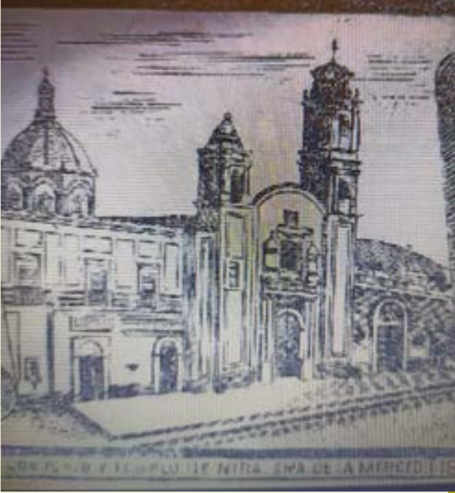
Antiguo templo de la Merced