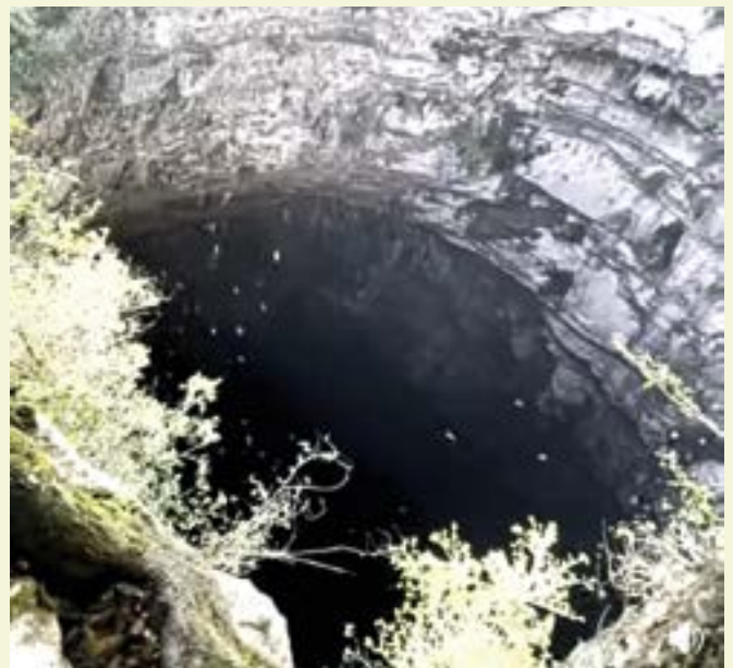
Sótano de las Golondrinas

Así, han dado a conocer los habitantes de la zona quienes desde pequeños sus padres los enseñaron a cuidar la naturaleza y este abismo de 512 metros de profundidad en el cual habitan y que piden se respete de todo aquello que lo pueda contaminar y destruir. Un antecedente del ecocidio es lo que sucedió un 6 de mayo del 2024 con el Grupo Vidanta, tras los hechos que se originaron cuando 2 helicópteros de la empresa volaron encima del Sótano natural para grabar una película y con la fuerza del enorme aparato mataron a más de 3 mil aves. Los responsables ingresaron sin permiso a la zona protegida afectando a las comunidades de Temapatz y Barrio Unión de Guadalupe. En charla con Rosa María Balvanera, representante legal de la zona Tének del municipio de Aquismón que protege al Santuario del Sótano de las Golondrinas agregó que " los habitan-