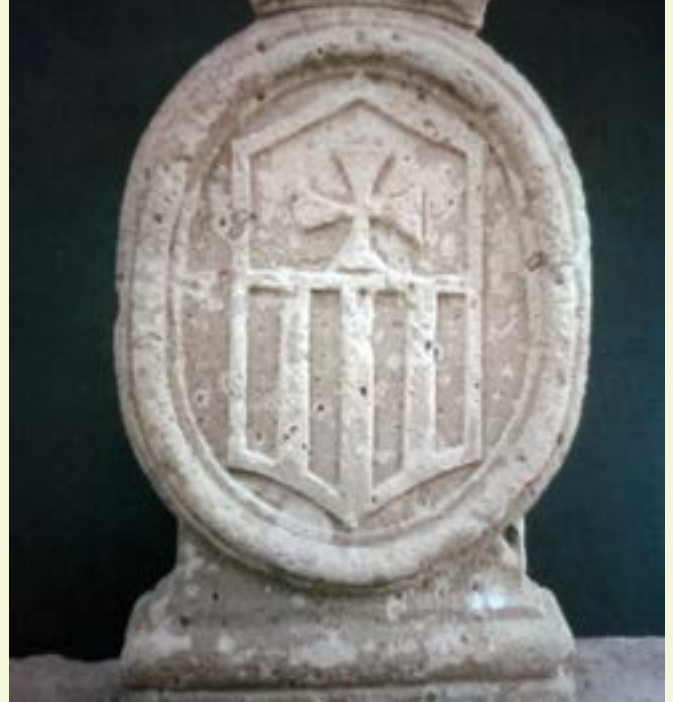
Medallón de la orden de la Merced