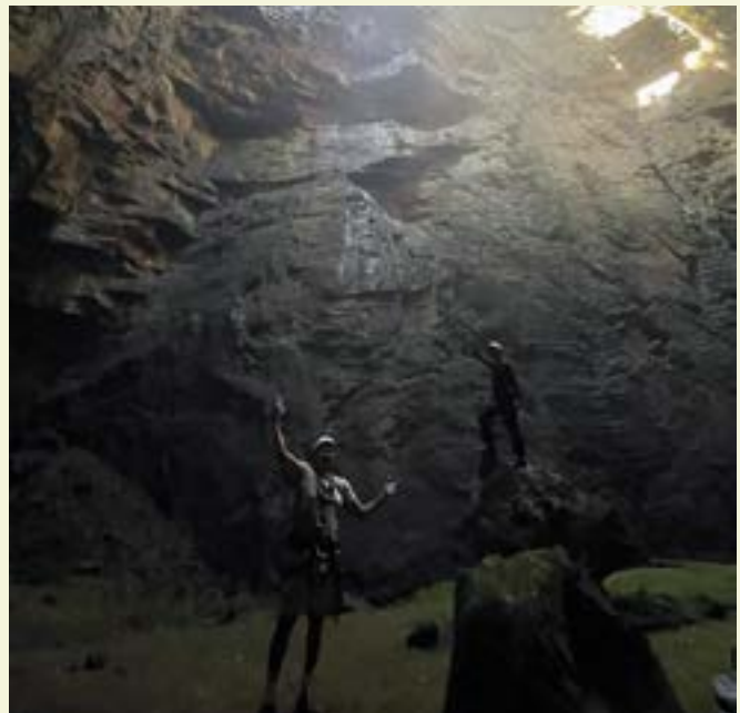
El Sótano de las Golondrinas sufrió un ecocidio por dos helicópteros en el 2024