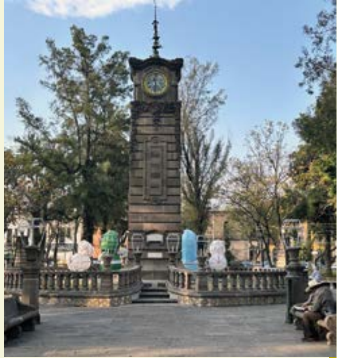
Jardín Colon con su bello reloj

Explica que cuando los monjes mercedarios se quedaron sin casa por la demolición del templo y ex Convento, los tres últimos frailes se fueron a vivir al Santuario de Guadalupe e incluso uno de ellos está enterrado en ese lugar y se conserva la placa. La demolición se hizo para “contribuir al embellecimiento de la Ciudad y comunicar Zaragoza con la calle de Guadalupe”. Afirma que cuando se hace la demolición “se permitió a la gente llevarse escombros y una familia de la colonia Tercera Grande se llevó el Medallón, reliquia de la orden de