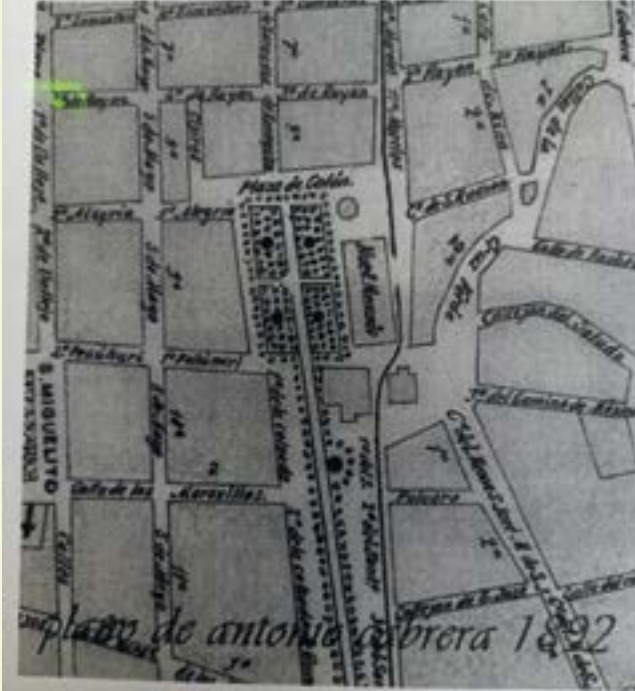
Plano antiguo del templo y Exconvento de la Merced