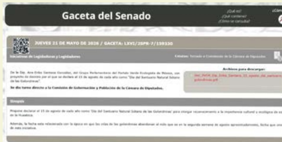
Gaceta de la Cámara en México, avanza el Decreto para proteger al Sótano de las Golondrinas de SLP

» Una propuesta que permitirá la amplia protección del Sótano de las Golondrinas, es el esfuerzo de aquellos que luchan por mantener su identidad y origen.